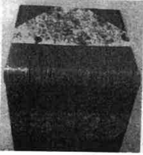
Colette : La naissance du jour

Le lieu ? L'étude de Marseille Enchères Provence, rue Curtel